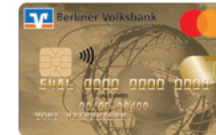
Gold Weltkugel Designcode 27