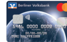
Heimatplanet Designcode 39