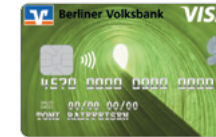
Naturliebe (nur Classic- und BasicCards) – Designcode 48