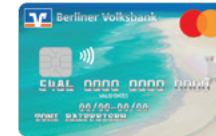
Sandstrand Designcode 40