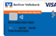
Standard blau Designcode 1